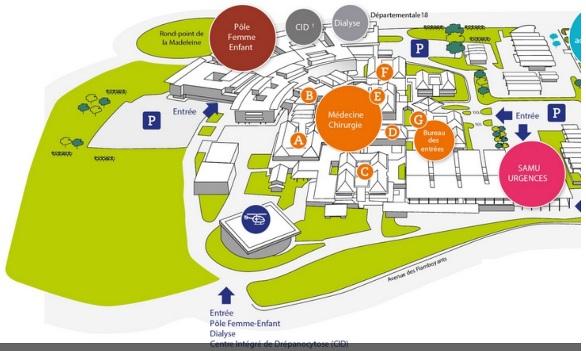
Plan des différents services au CHAR de Cayenne